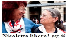
Nicoletta libera! pag. 60

Manuale per evitare le liste d'attesa il modulo da compilare pagine 21, 22, 23